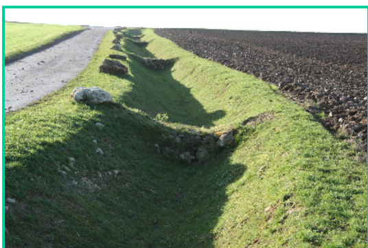
Fossé à redents au voisinage d'une parcelle cultivée

Ce type de dispositif constitue une catégorie de zone tampon intermédiaire, partageant des caractéristiques communes avec les dispositifs enherbés (fiche n°6) et les dispositifs de type plan d'eau (fiche n°8).