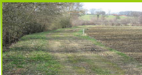
Exemple de bande enherbée dégradée par le passage d'engins agricoles.

Enfin, tout traitement phytosanitaire ou épandage d'engrais est évidemment exclu !