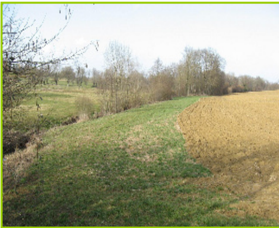
Bande enherbée entre une parcelle cultivée et un cours d'eau

Les dispositifs enherbés sont des surfaces à couvert pérenne, constituées d'une végétation basse, herbacée (graminées), spontanée ou implantée. Parmi les différents types possibles, les bandes enherbées rivulaires sont les mieux connues ; elles ont été rendues obligatoires par l'arrêté du 12 septembre 2006 de manière à dégager une Zone Non Traitée d'au moins 5 m de large le long des cours d'eau classés BCAA (Bonnes Conditions Agri-Environnementales définies dans le cadre de l'éco-conditionnalité des aides issues de la PAC). Toutefois une implantation étagée dans les bassins versants, au plus près des sources de contamination, présente elle aussi un fort intérêt du point de vue de la maîtrise des processus d'érosion et de pollutions diffuses.