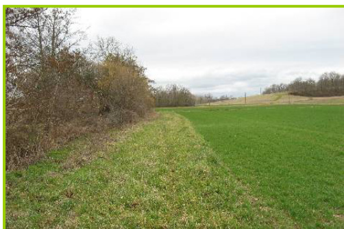
Exemple de bande enherbée modèle après quelques années d'un entretien adéquat : un couvert dense et une bonne continuité avec la parcelle cultivée (Gril et Le Henaff, 2010)

L'entretien de ce type de dispositif vise à obtenir le plus rapidement possible un couvert dense, en évitant la montée en graines des adventices. Pour ce faire on procédera la première année à une fauche précoce au printemps, éventuellement suivie d'un roulage, pour favoriser la densification du couvert et nettoyer le dispositif enherbé.