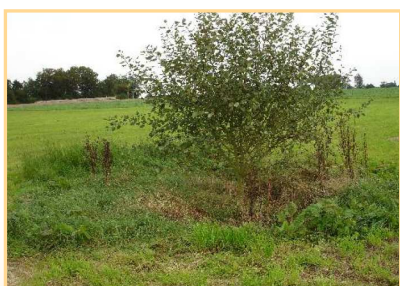
Bétoire enherbée proche d'une parcelle agricole. La végétation protège la bétoire et permet ainsi de limiter les transferts rapides de contaminants d'origine agricole vers les ressources en eau souterraine.

En présence d'écoulements hydrauliquement concentrés, qu'il s'agisse d'eaux de ruissellement ou d'eaux de drainage collectées par un réseau de fossés, un dispositif de type plan d'eau sera généralement plus adapté. Dans ce cas, c'est le temps de séjour de l'eau (et des contaminants qu'elle véhicule) qui constitue le principal critère d'efficacité en permettant aux différents processus de dégradation, qu'ils soient biologiques ou abiotiques, de se dérouler correctement.